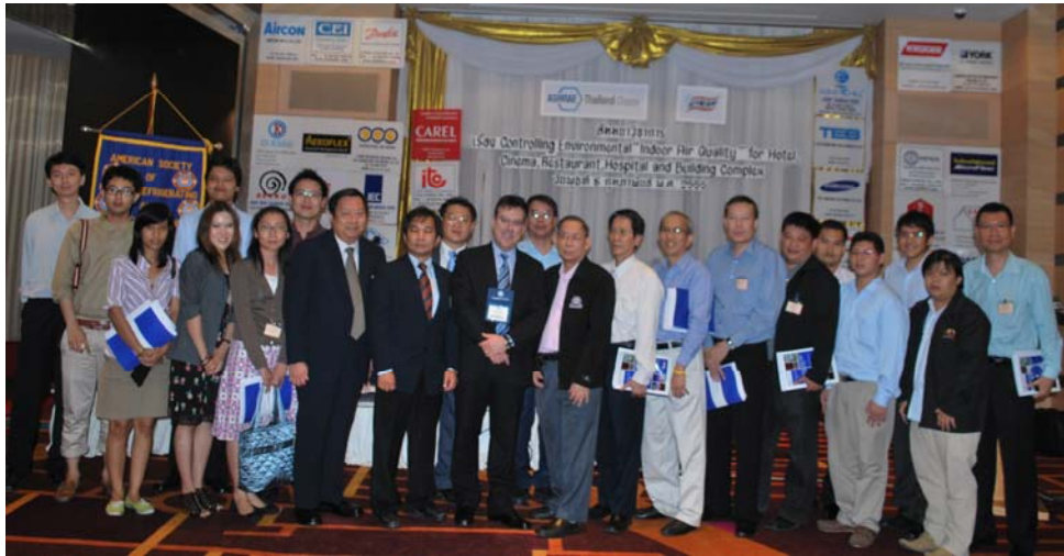
วิทยากร ,กรรมการ และผู้เข้าร่วมสัมมนาวิชาการถ่ายรูปร่วมกัน