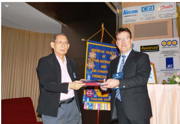
ศาสตราจารย์ ดร.เวชพฤติ BGS. มอบของที่ระลึกให้กับวิทยากร