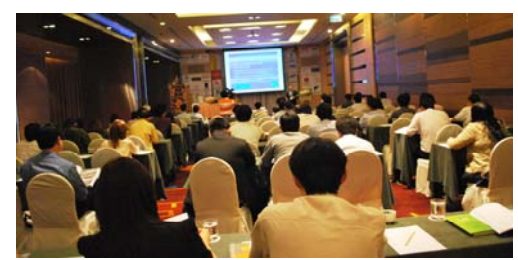
บรรยากาศภายในงานสัมมนาวิชาการ