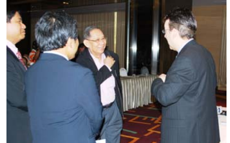
บรรยากาศภายในงานสัมมนาวิชาการ