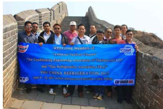
ชมกำแพงเมืองจีน โดยขึ้นทาง คำนจินชานหลิง (Jinshanling) ซึ่งเป็นด่านที่สวยงามที่สุดของกำแพงหมื่นลี้ ตั้งอยู่ในเขตมณฑลเหอเป่ย์