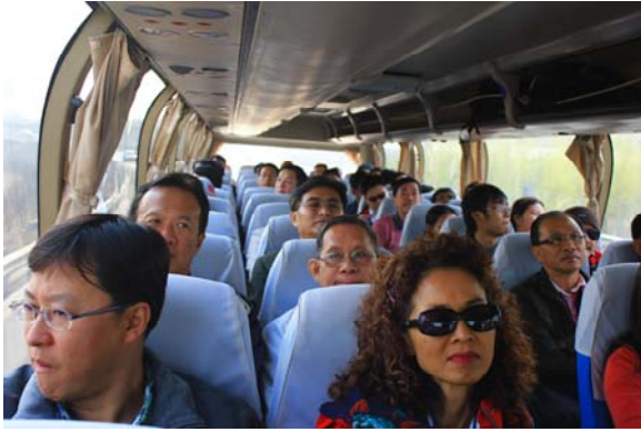
ภายในรถปรับอากาศ