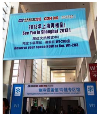
บริเวณด้านนอกทางเข้า Exhibition