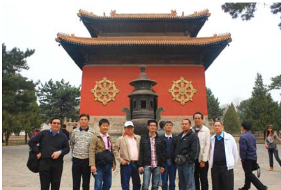
ชมวัดโปตาลางน้อย วัดนี้สร้างขึ้นในปี 1769 มีพื้นที่ 54 เอเคอร์ เป็นวัดที่ใหญ่ที่สุดในเจียงเต๋อ