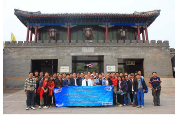
เที่ยวชม พระราชวังฤดูร้อน (ปู้สูซานจง)