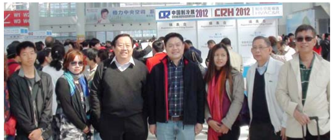
ลงทะเบียนก่อนเข้างาน