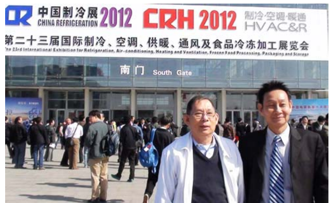
ถ่ายภาพร่วมกันบริเวณด้านนอกอาคาร Exhibition