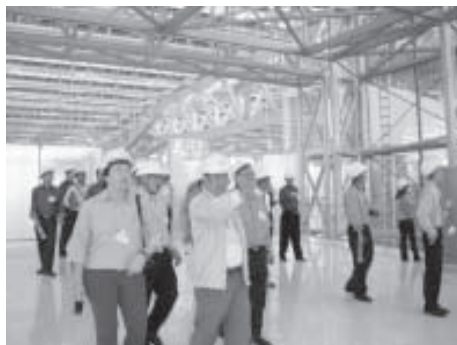
ASHRAE Thailand Chapter ร่วมกับ สมาคมวิศวกรรมปรับอากาศแห่งประเทศไทย จัดเยี่ยมชมดูงาน ณ สนามบินสุวรรณภูมิ ในวันที่จันทร์ที่ 26 ธันวาคม 2548