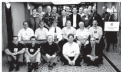
The ASHRAE Student Activities Committee at the Annual Meeting in Denver, Colorado