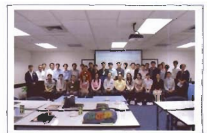
สมาชิกถ่ายรูปร่วมกัน