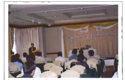
บรรยายภาคภายในห้องสัมมนา

วันพุธที่ 10 มิถุนายน 2552 ASHRAE Thailand Chapter ร่วมกับ สมาคมวิศวกรรมปรับอากาศแห่งประเทศไทย จัดโปรแกรมทัศนศึกษาเยี่ยมชมดูงาน โรงงานผลิตฮาร์ดดิสก์ไดรฟ์ เวสเทิร์นดิจิตอล(ประเทศไทย)