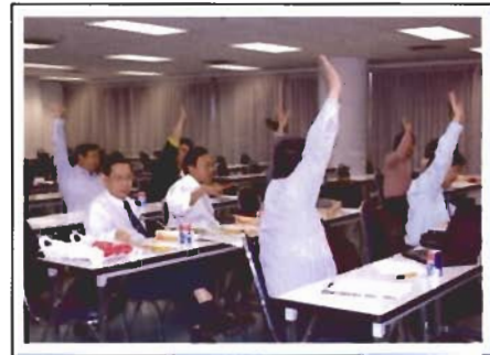
บรรยากาศในการเลือกตั้ง คณะกรรมการชุดใหม่วาระ: 2009-2010